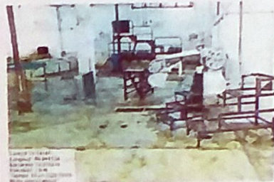
SALA DE MATANZA RASTRO MUNICIPAL DE CANCUN