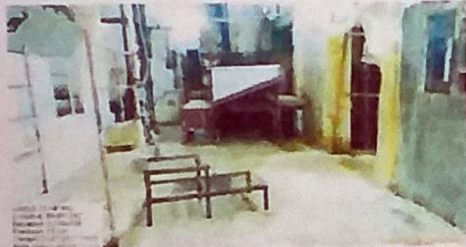
SALA DE MATANZA RASTRO MUNICIPAL DE CANCUN